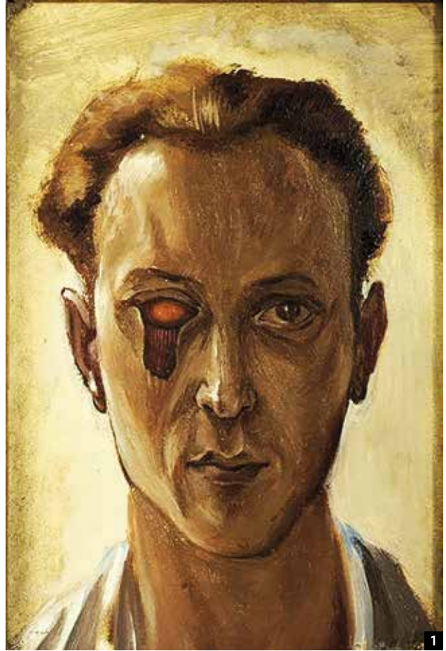
1 Victor Brauner Selbstporträt mit verletztem Auge 1931, Öl auf Holz, 22 x 16 cm. © VG Bild-Kunst, Bonn 2018

Wenn man den Goethe'schen Ansatz aufgreift und auf die Kunst überträgt, ergeben sich für viele Werke, vor allem seit dem 20. Jahrhundert, neue und ungewohnte Perspektiven, die mit der Frage zusammenhängen, was ein Künstler erlebt, was ihn geprägt, beeindruckt, fasziniert oder gequält hat – und wie er seine geistig-seelischen Eindrücke und Zustände in einem Werk zum Ausdruck bringt. Wenn Künstler schwere psychische Verletzungen nicht verarbeiten konnten, schaffen sie nicht selten Werke, die für eine Gesellschaft zur Belastung werden und alles andere als bereichernd sind. Manches Bild lässt sich unter