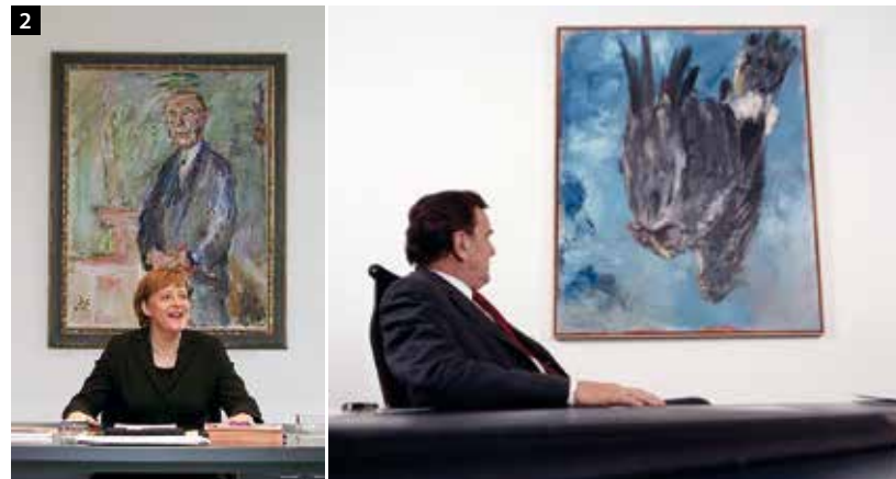
2 Können Bildinhalte auf die Dauer von Amtszeiten Einfluss nehmen? Angela Merkel mit dem Kokoschka-Porträt von Konrad Adenauer und Gerhard Schröder mit dem herabstürzenden Adler von Georg Baselitz

Ein anderes Beispiel: Im Jahre 1970 wurde der Roman Thirty Seconds Over New York von Robert Buchard verfilmt, der sich geradezu als Inspiration für die Terroristen des 9/11-Attentats liest (Abb. 3). Roman und Film erzählen von einem Wasserstoffbombenangriff auf New York, den chinesische Terroristen mithilfe eines Passagierflugzeugs durchführen, das sie auf zwei New Yorker Hochhäuser lenken. In diesem Film finden sich zahlreiche Szenen, die den Schreckensbildern am Tag des Anschlags nicht unähnlich sind. (Abb. 4). Nur ein Zufall? Oder ein Beleg für die These, dass Energie der Aufmerksamkeit folgt und Szenarien aus Bild und Film sich irgendwann umso wahrscheinlicher realisieren, je mehr von ihnen produziert wird? Lassen sich die Ereignisse vom 11. September 2001 also als materialisierte Folge von Endzeitszenarien verstehen, wie sie nicht zuletzt in Hollywood seit Jahrzehnten produziert werden? Wurde die in diesen Filmen vorweggenommene Potenzialität im Sinne der Quantenphysik zu Realität?