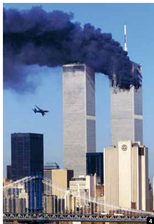
3 DVD-Cover des Endzeitfilmes Thirty Seconds over New York von Robert Buchard