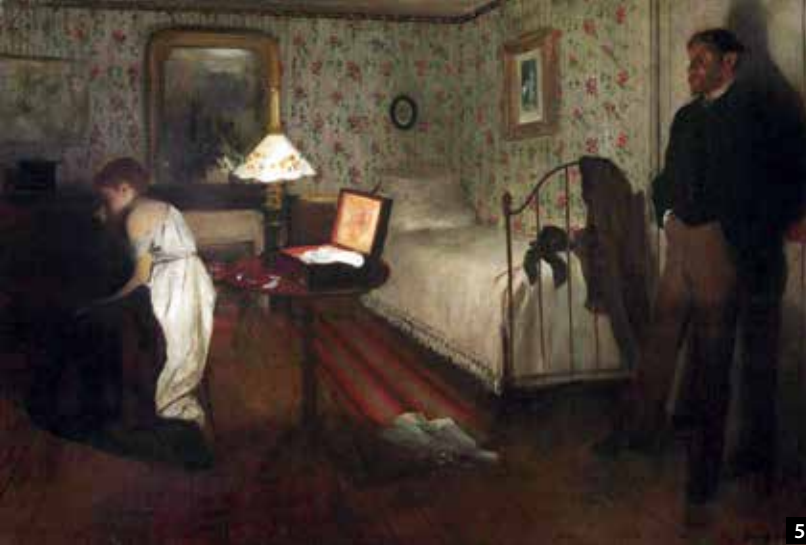
5 Edgar Degas Die Vergewaltigung (Le viol) 1868/69. Öl auf Leinwand, 81 x 114 cm.

Es gibt durchaus einige Kunstschaffende – im Bereich der Filmkunst, der bildenden Kunst und der Literatur –, die das hohe Gut der Kunstfreiheit mit einem Freibrief für Willkür verwechseln. Die Kunst darf heute alles zeigen, was sie will. Das muss auch so sein und so bleiben. Doch ergeben sich daraus Fragen: Darf die Kunst das wirklich? Gibt es im Berufsstand der Künstler tatsächlich eine Freiheit ohne Verantwortung? Eine Freiwillige Selbstkontrolle (FSK), wie sie in der Filmwirtschaft seit Jahrzehnten üblich ist, wäre gelegentlich auch für die Kunstbranche durchaus wünschenswert.